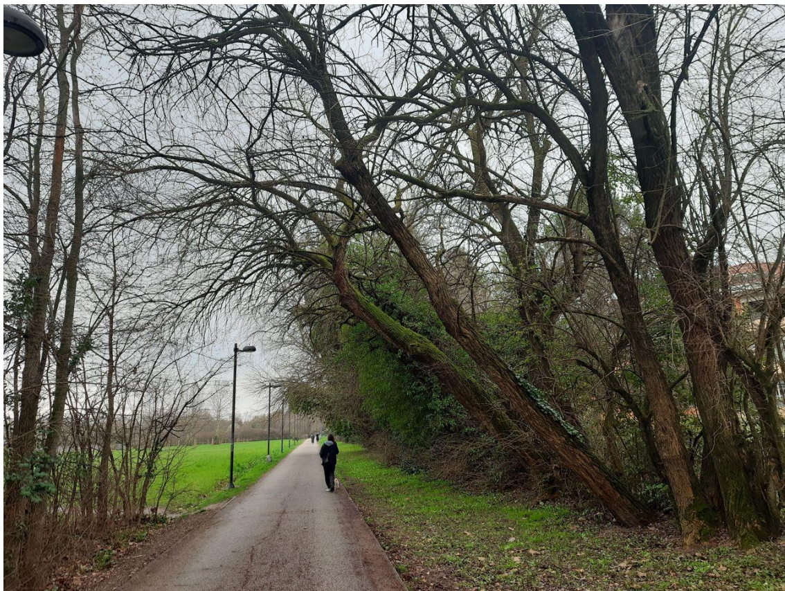
Figura 6: particolare dell'inclinazione di alcune piante

Si riporta di seguito la documentazione fotografica del filare, rimandando alle didascalie delle singole immagini per la loro descrizione.