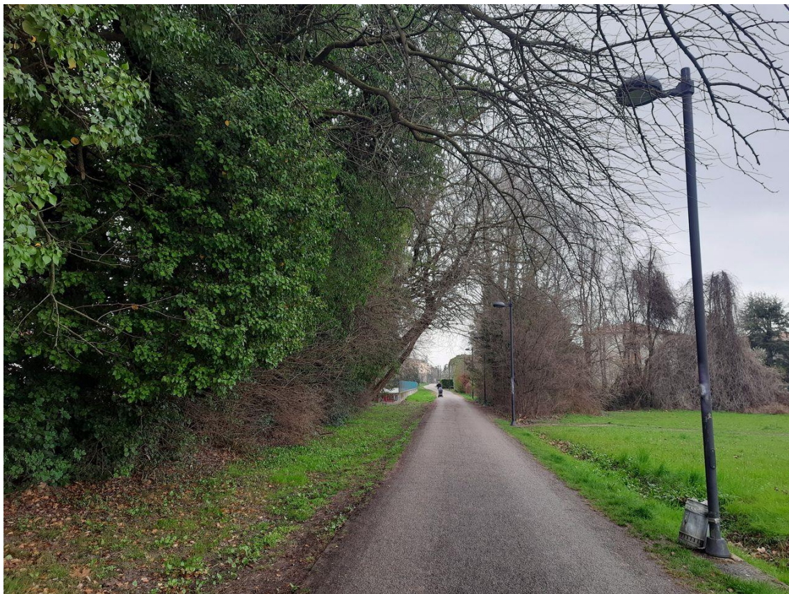
Figura 10: particolare dell'interferenza delle chiome con l'illuminazione