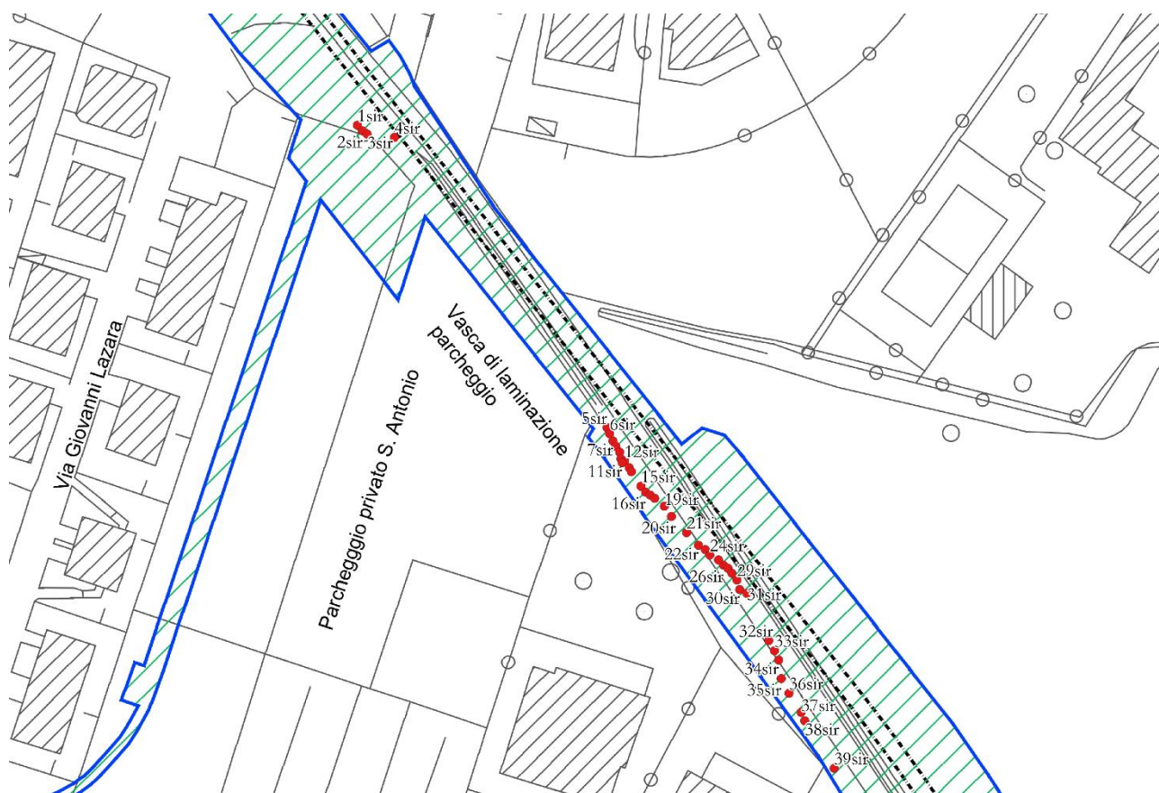
Figura 3: sovrapposizione delle piante sulla tavola di progetto e CTR