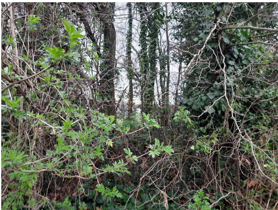
Figura 8: particolare dell'area invasa da edera