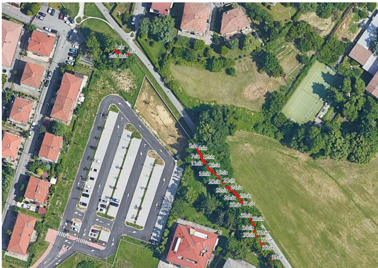
Figura 5: sovrapposizione delle piante a ortofoto