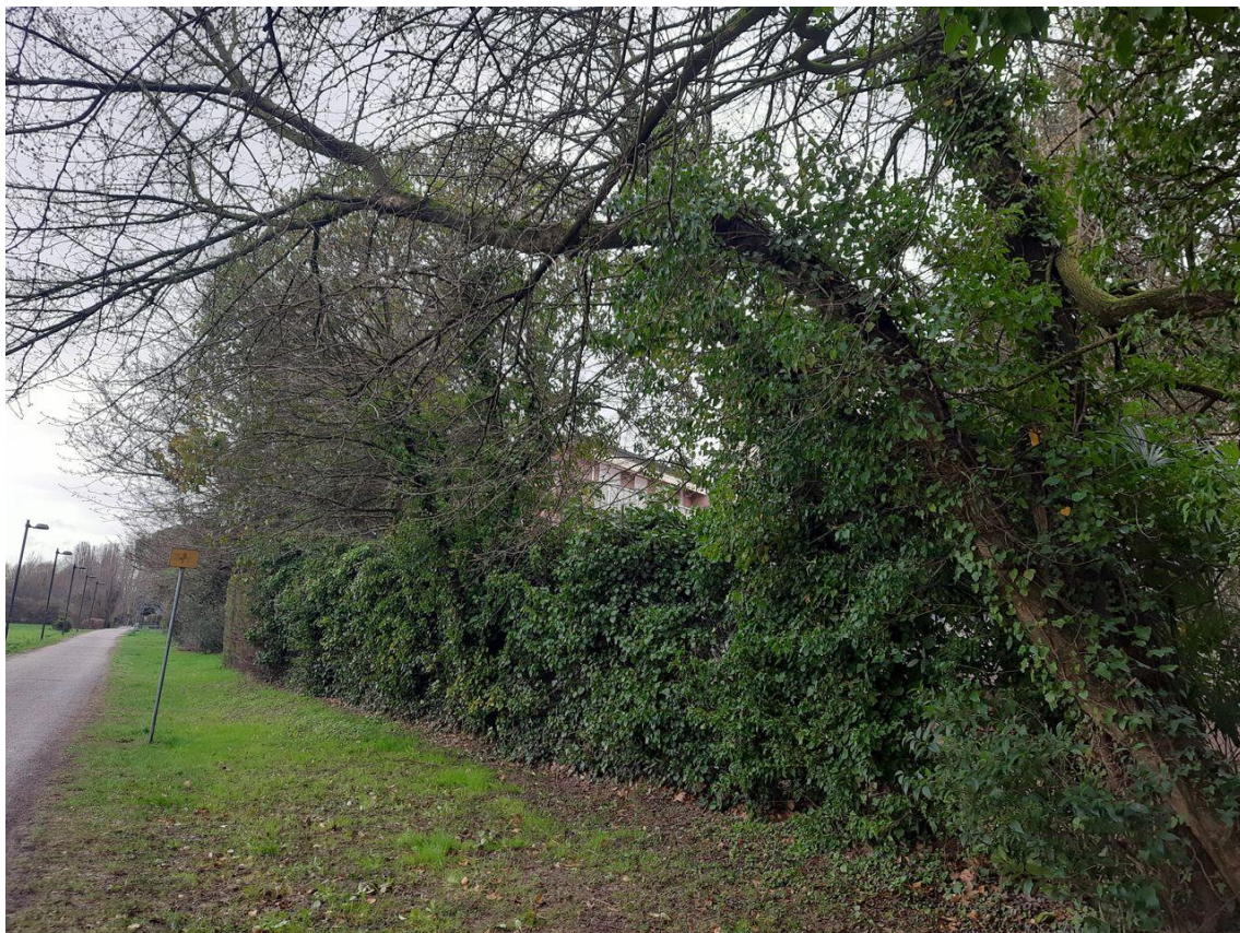
Figura 11: particolare della sinuosità dei fusti