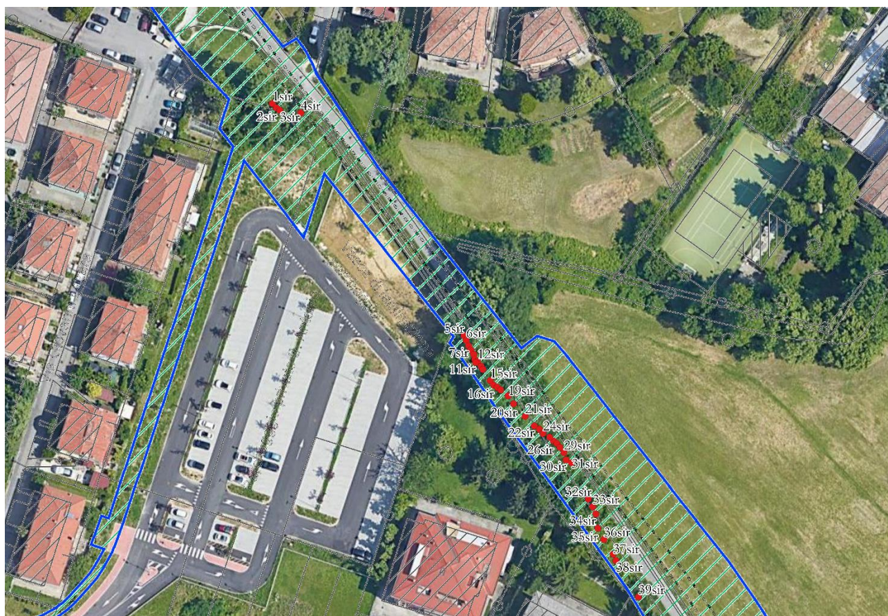
Figura 4: sovrapposizione delle piante sulla tavola di progetto e ortofoto