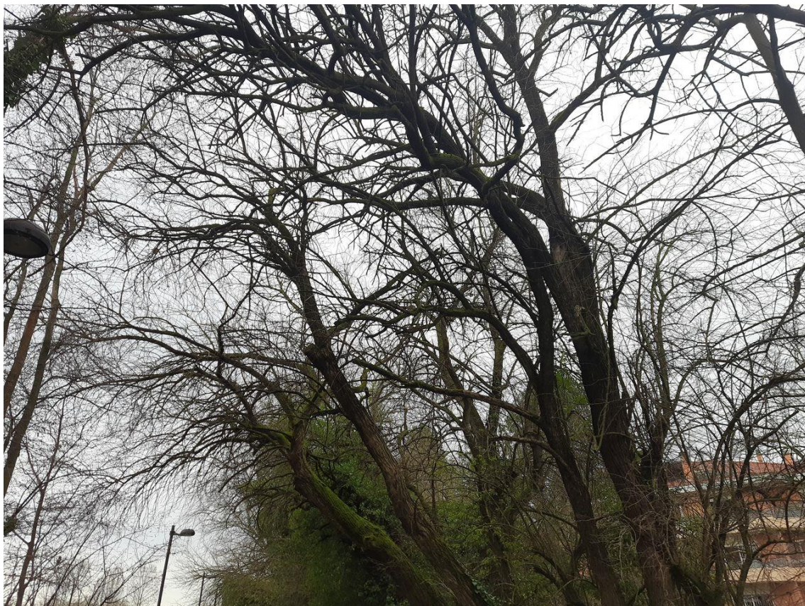
Figura 7: particolare dell'inclinazione di alcune piante