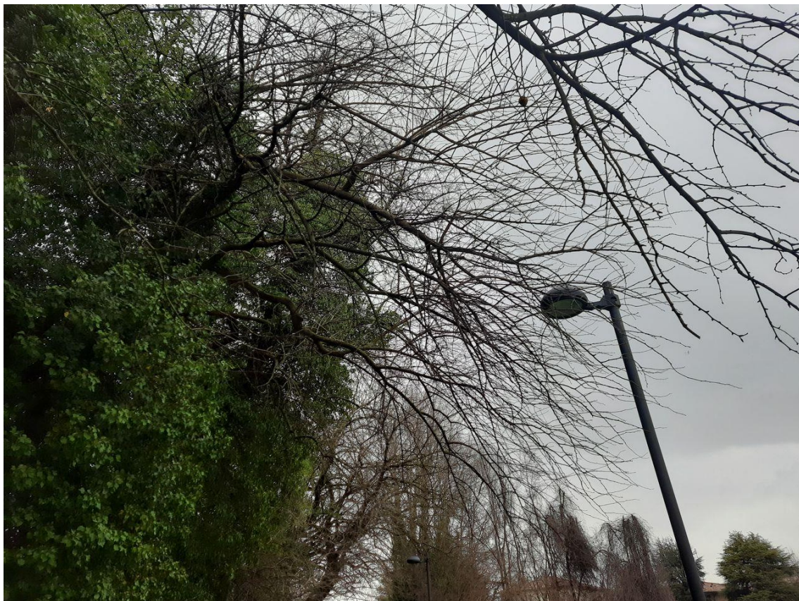
Figura 9: particolare dell'interferenza delle chiome con l'illuminazione