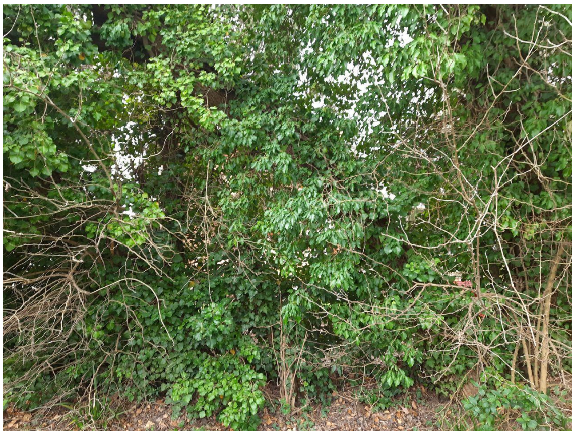
Figura 12: particolare dei fusti ricoperti da edera