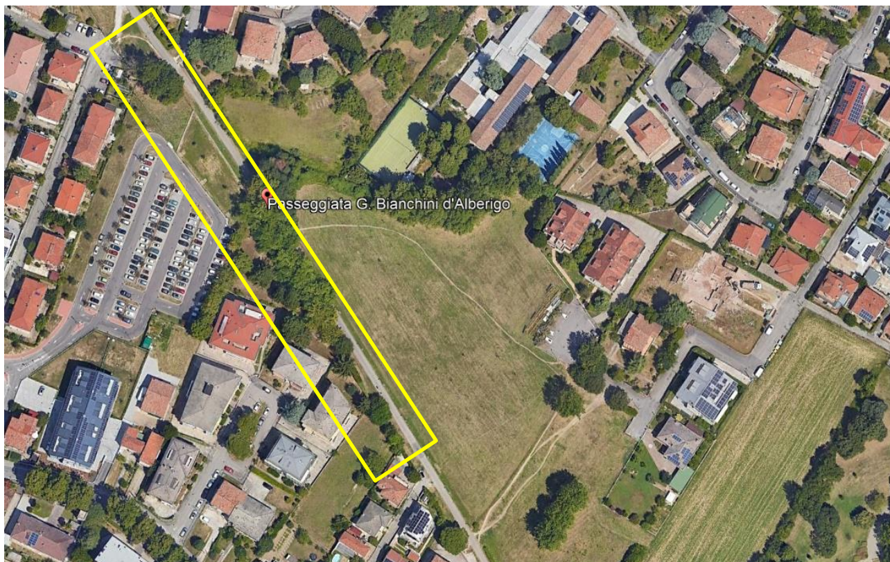
Figura 1: individuazione delle piante oggetto di analisi

Le piante della presente relazione dimorano lungo il lato Ovest della Passeggiata G. Bianchini d'Alberigo. Viene di seguito riportata un'ortofoto della zona con evidenziata la posizione delle piante oggetto della presente relazione.